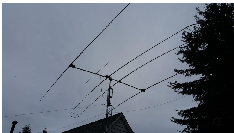
Antena na wyższe pasma Barry'ego VA7GEM