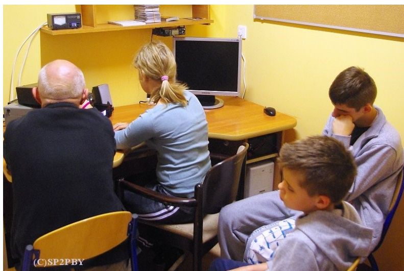
Nauka pracy na nowym, mówiącym urządzeniu.

Dzieciaki z sekcji młodzieżowej oraz zarząd klubu SP2PBY pragną złożyć Zarządowi Głównemu PZK gorące podziękowanie za zakupiony sprzęt, ale przede wszystkim za zrozumienie ich trudnej sytuacji.