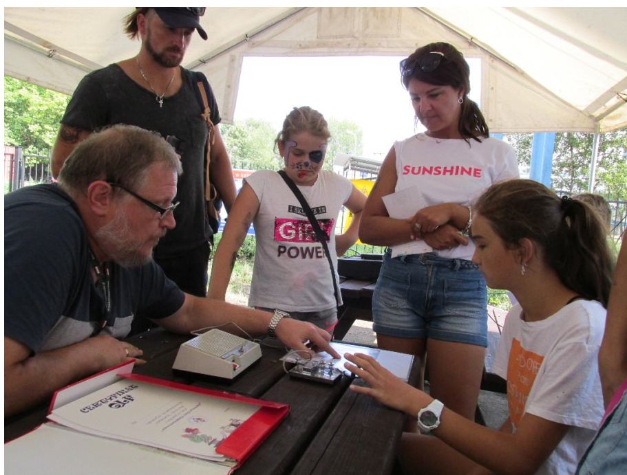
Promocja krótkofalarstwa podczas „Święta Flagi” w 2018 roku

Grupa krótkofalowców Zachodniopomorskiego Oddziału Terenowego PZK po raz drugi będzie brała udział w uroczystości zawieszeniu flagi RP na latarni morskiej w Świnoujściu. Zostaliśmy zaproszeni do udziału przez Stowarzyszenie Miłośników Latarni Morskich w Szczecinie. Latarnia w latach 1958-1999 r. była również radiolatarnią, nadawała wówczas na częstotliwości 287,3 kHz emisją A2A sygnał Morse „OD”. Jest to znakomita okazja do promowania krótkofalarstwa w gronie uczestników tej imprezy, jak i wśród turystów odwiedzających latarnię.