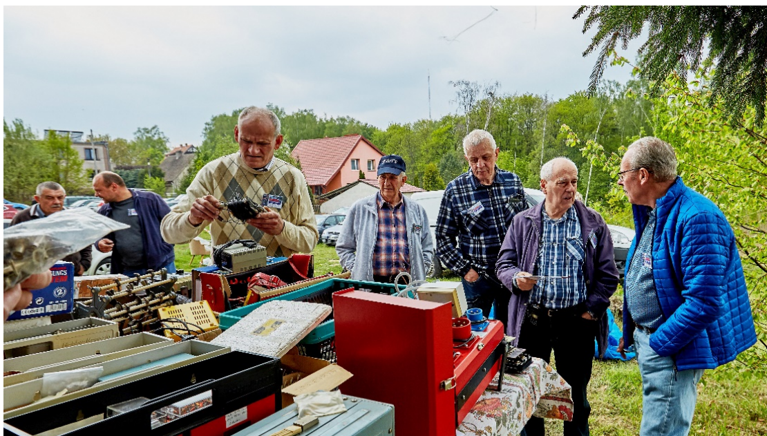
Uczestnicy spotkania w Łagowie na giełdzie