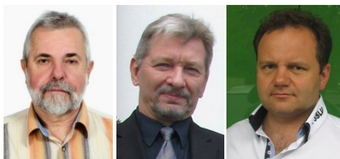
Redakcja Komunikatów PZK:

Komunikaty PZK są nadawane w każdą środę o godzinie 18:00 czasu lokalnego na częstotliwości 3702,5 KHz +/- QRM., a materiał w nich zawarty jest wykorzystywany przez Redakcję Krótkofalowca Polskiego.