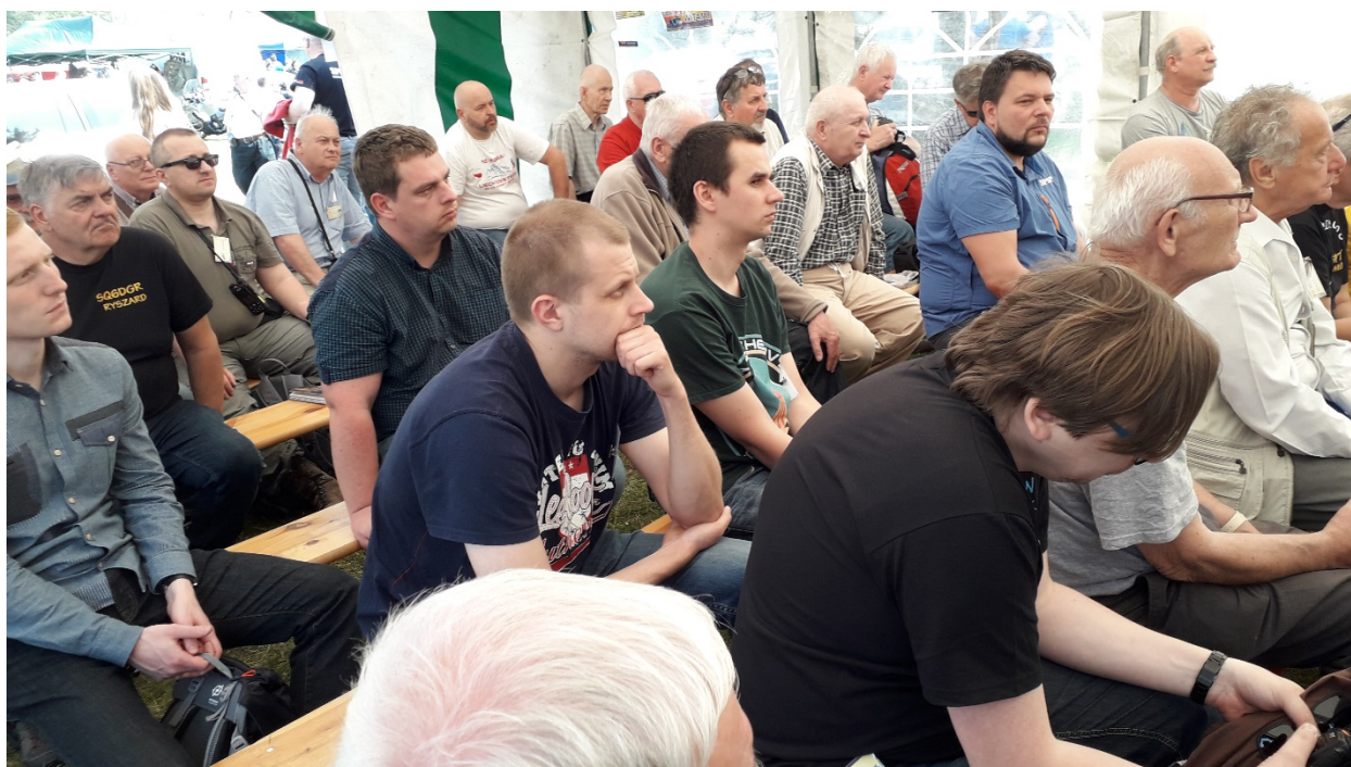
Namiot prelekcyjny podczas prezentacji

W imieniu organizatorów